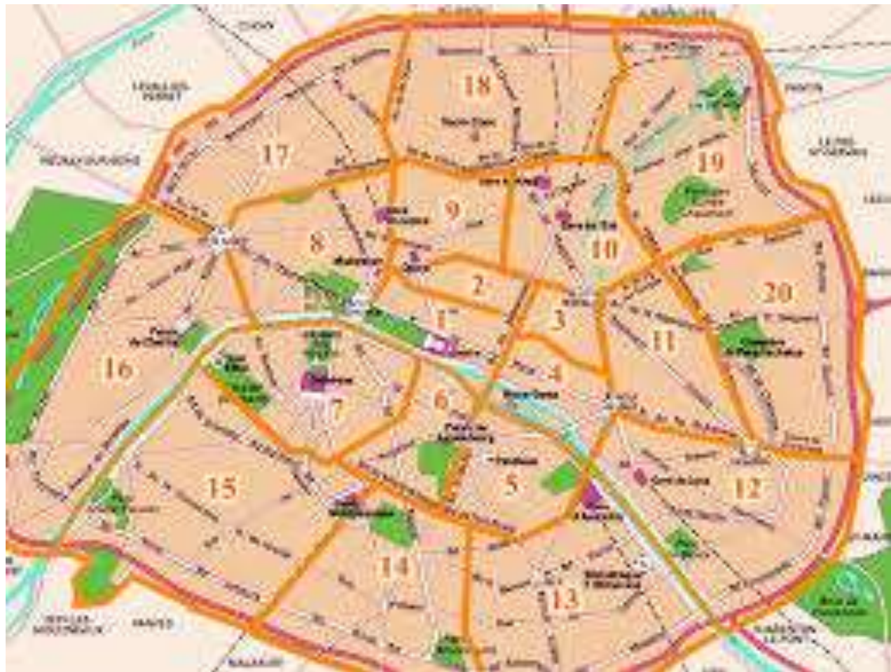
Les 20 arrondissement de Paris